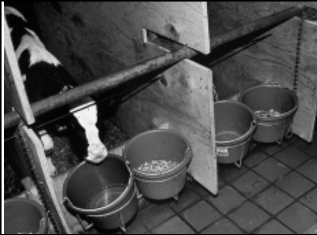
Рисунок 3: Кормление зерновым начальным рационом с высокими вкусовыми качествами и водой обеспечивает быстрое развитие рубца и ранний отъем.

возраста обычно приводит к более высокому уровню смертности. С другой стороны, отъем произведенный позднее восьминедельного возраста приводит к большим затратам по следующим причинам: